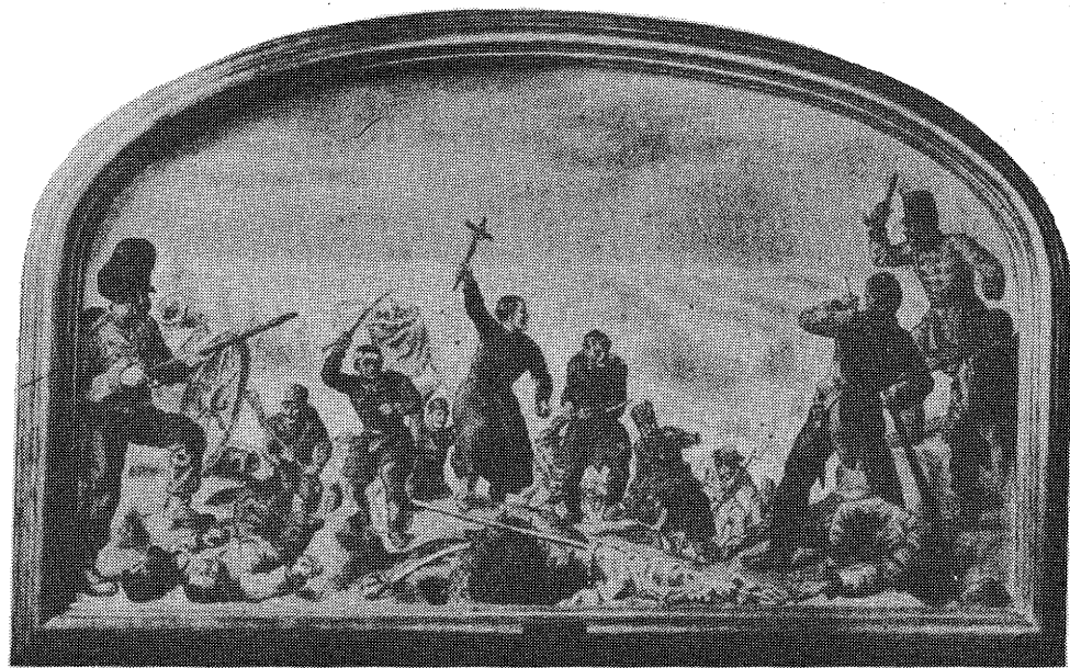
Erdősi Imre, a branyiszközi hős

Erdősi (Poleszni) Imre: 1849 januárjában Görgey serege Selmecebányára került. A 8. dandár parancsnoka az angol származású Guyon Richárd január 12-én a selmecebányai piaristáktól papot kért vegyesajkú legénysége lelki gondozására. Erdősi önként jelentkezett. Már január 18-20-án részt vett a szomorú ki-menetelű szélaknai csatában. Ezután Guyon dandára Besztercebányára, majd Iglóra ment, azután Szepesváraljára. A további előnyomulást az ellenség kezén lévő branyiszközi szoros tette lehetetlenné. Február 5-én Erdősi a rohamozó magyar csapat élén, keresztrel a kezében győzelemre vezette katonáit, elfoglalták a szorost, és Sirokáiig üldözték az ellenséget. A sirokai templomban Erdősi Te Deumot tartott, és ott hagyta emlékül a vörösfenyőből készült feszületet, amellyel a branyiszközi győzelmet kivívta. Február 27-én részt vett a kápolnai csatában. Ekkor vette föl az Erdősi nevet. A nagysallói (április 19.), majd a komáromi csatában is találkozunk Erdősivel. Június 11-én Jellasics ellen vívott csatában szerepel Hegyesnél, majd a mosorini (július 23.), szőregi (aug. 5.), temesvári (aug. 9.) és a lugosi csatában. A világosi fegyverletétel után Facseten (Krassó megye) búcsúzik el Guyontól, aki Bemmel együtt török szolgálatba lép.